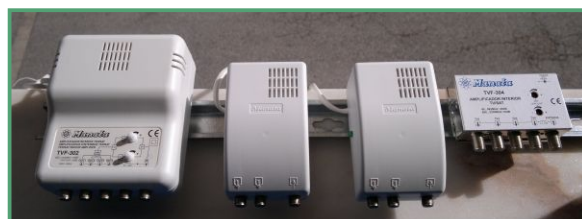
Suporte para fixação na barra DIN